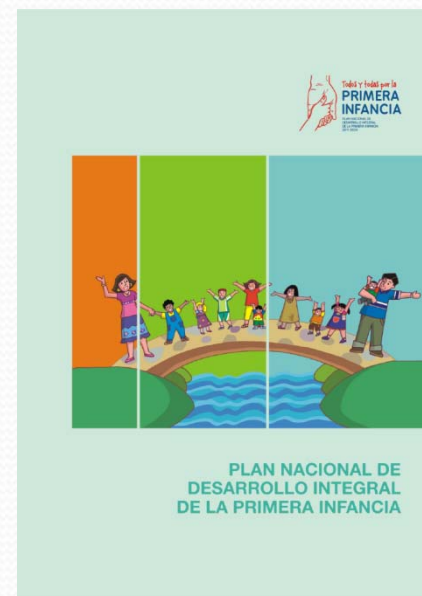
Plan Nacional de Desarrollo Integral de la Primera Infancia 2011-2020