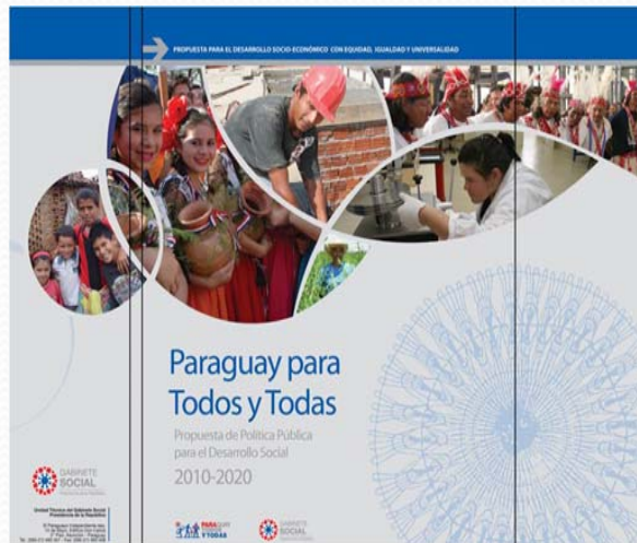
Propuesta de Política Pública para el Desarrollo Social 2010-2020