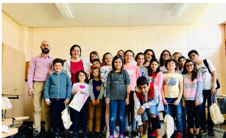
II Jornada suiza de lectura en voz alta. Programa "La magia de la voz" de la Consejería de Educación en Berna en la Agrupación de Lengua y Cultura de Lausana. Mayo de 2019. Aula de Écublens (Vaud)

En el Ticino, desde el nivel preescolar, la actividad semanal es de cinco días, de lunes a viernes, con una tarde libre el miércoles. En una parte importante de las escuelas hay jornada continua.