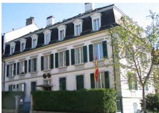
La Consejería de Educación de la Embajada de España

https://www.eda.admin.ch/aboutswitzerland/es/home.html