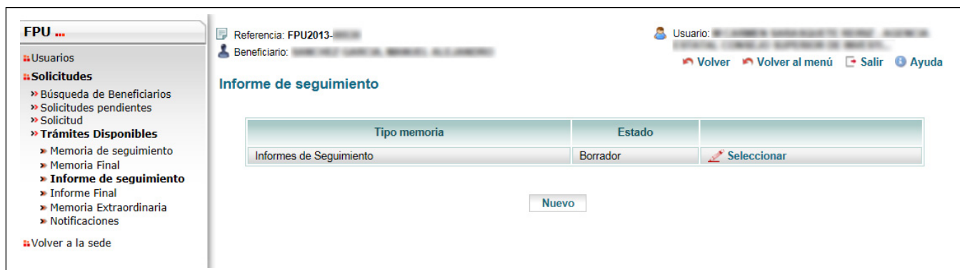
Figura 3. Trámites Disponibles – Informe de seguimiento – Nuevo