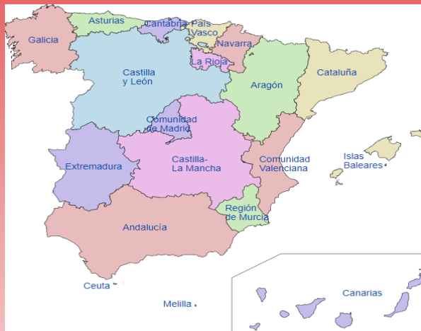
* Communautés Autonomes d'Espagne

Quant aux centres, il peut s'agir d'écoles primaires, secondaires et d'écoles officielles de langues pour adultes.