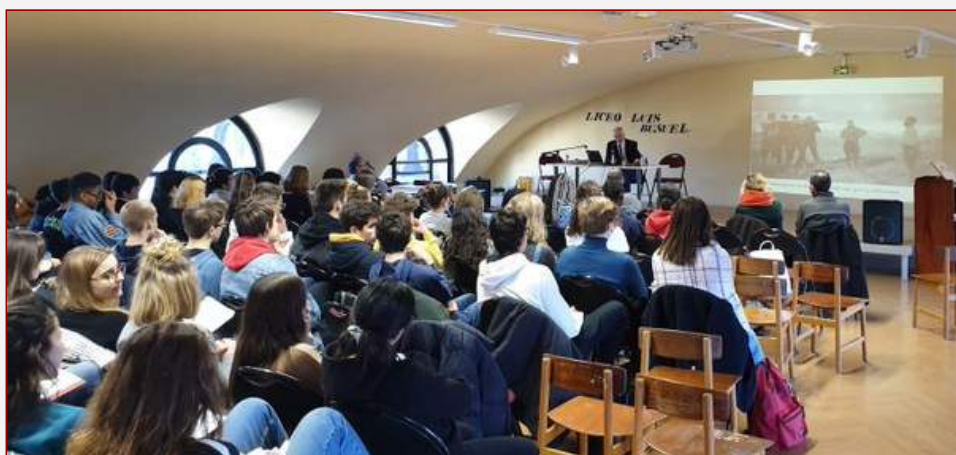
El LELB en una actividad conjunta Bachibac con el lycée Albert Camus

Respecto a los canales y medios telemáticos empleados, el LELB no cesa en su empeño de mejorar los conocidos y explorar nuevas opciones. A los ya mencionados debemos añadir: canales de Youtube, Google Sites, Google Classroom, Google Drive (presentaciones, formularios, documentos), Kahoot 7 , Doodle 8 , Padlet, podcasts , Hangout, etc.