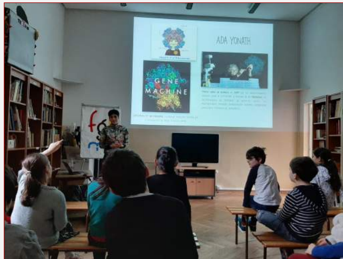
Semana Mujer y ciencia en el CEFGL

Tras la experiencia adquirida durante esta primera semana, se ha realizado una valoración del funcionamiento del proceso educativo por parte del profesorado y del equipo directivo. Respecto a la organización del trabajo, consideran que están funcionando bien, por lo que ven conveniente seguir con el cuadrante semanal y el Drive compartido. Todos los/as tutores/as se comunican con las familias y los niños a través de diferentes aplicaciones. En algunos casos, se considera que el número de tareas es excesivo, por lo que se ve conveniente reducir el volumen de tareas, especialmente para los más pequeños. En cuanto a la valoración general de las familias es positiva y de agradecimiento.