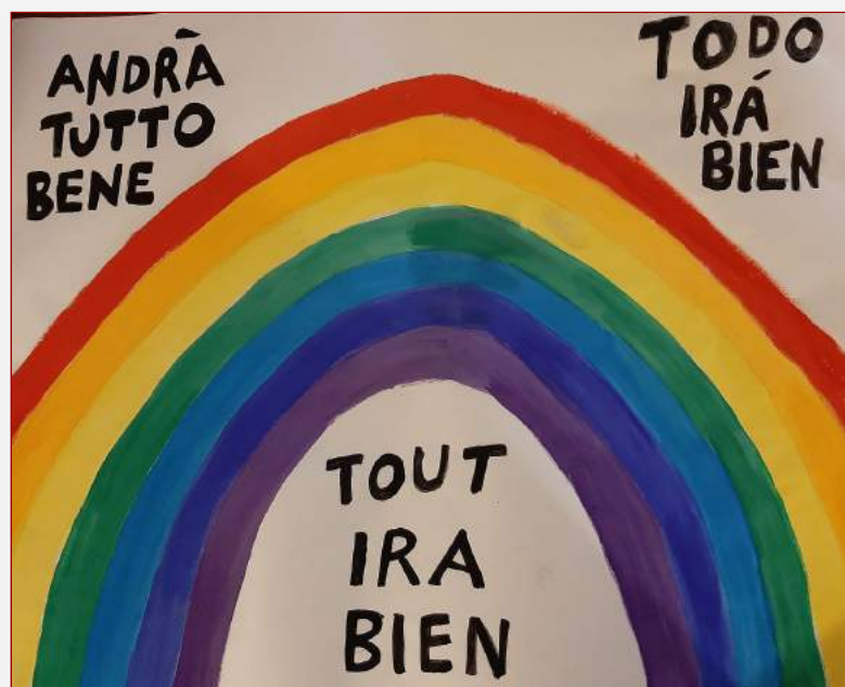
El CEFGL ha adaptado la campaña Tutto andrà bene

Realizamos esta segunda crónica del confinamiento de los centros españoles en Francia próxima al inicio de las vacaciones escolares de primavera, un tiempo que vamos a vivir de una forma muy diferente a la habitual. Solemos asociar estas fechas a pensamientos y emociones positivas. Por ello, queremos haceros partícipes de la iniciativa que surgió en Italia de pintar arcoíris y colgarlos en los balcones como una forma de transmitir esperanza. En el país transalpino, los arcoíris iban acompañados del lema "Andrà tutto bene". Cuando empezó el confinamiento en España, muchos adoptaron esta idea y le añadieron el lema en español: "Todo irá bien". En Francia, el Colegio Español Federico García Lorca (CEFGL) se suma a la iniciativa e incorpora el lema en francés "Tout ira bien".