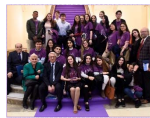
Centro Santa María de los Apóstoles. Madrid