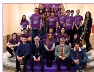
IES Antonio Machado. Soria