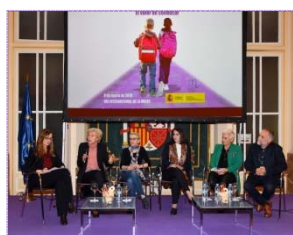
Imagen del coloquio