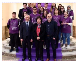
IES Clara Campoamor. Yunquera de Henares