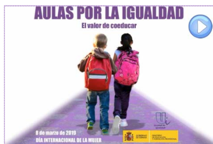
Video que se proyectó con fotos cedidas por los centros participantes en el acto 'Aulas por la Igualdad'

Ministerio de Educación y Formación Profesional Subdirección de Ordenación Académica