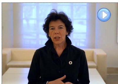
Palabras de la Ministra de Educación y Formación Profesional, Isabel Celaá, en el acto 'Aulas por la Igualdad'

Esta feminización de los estudios contrasta, sin embargo, con la masculinización del mercado laboral, donde las mujeres tienen peores tasas de empleabilidad en todos los niveles de formación entre los 25 y los 64 años, según datos de 2018. Las tasas de paro, cuando se restringen al grupo de mujeres entre 25 y 34 años, no solo no mejoran sino que aumentan más de tres puntos porcentuales en total y hasta 10 para aquellas que no han alcanzado la primera etapa de la Educación Secundaria.