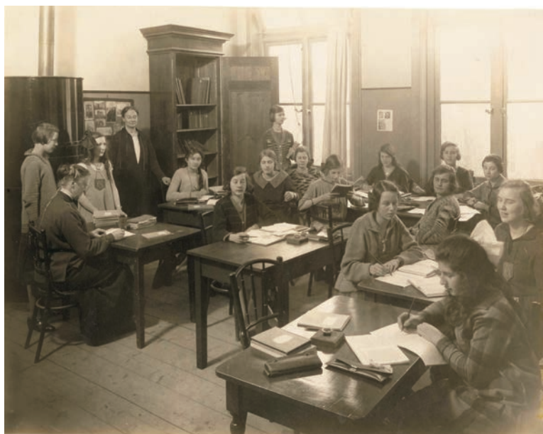
PHOTOGRAPH I. Dalton School for Girls, The Hague, 1921-1930

Source: http://haagescholen.nl/klassenfotos/81dc7d2c-4248-11e4-bd86-63edc8502247