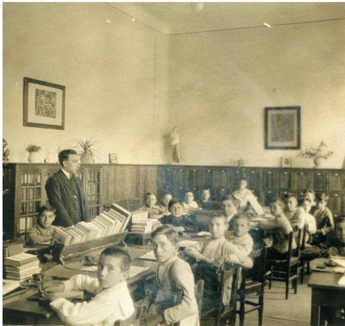
PHOTOGRAPH 2. School «Cervantes», circa 1930