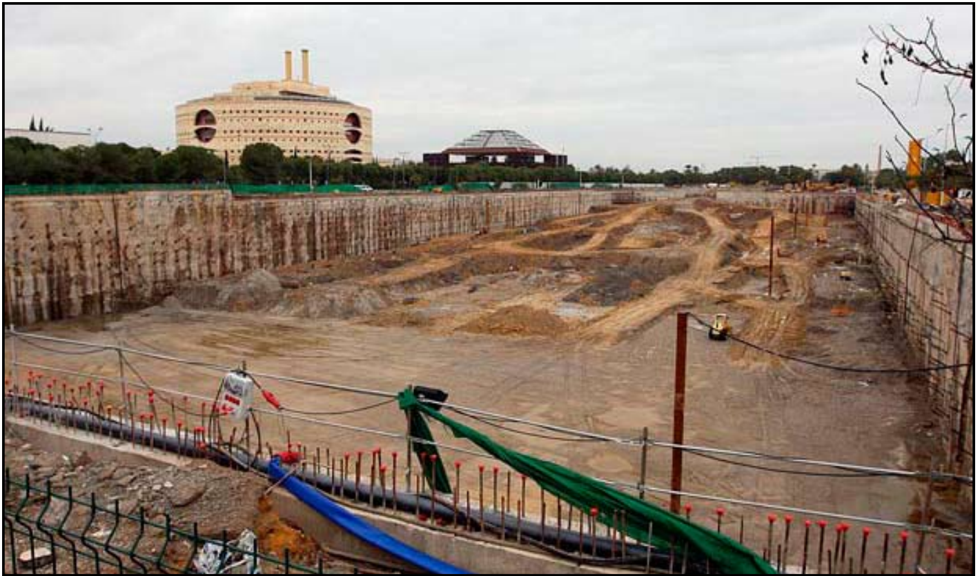
Aspecto de las obras de cimentación para la Torre Pelli, el 07-01-2010 en la isla de La Cartuja (Sevilla).