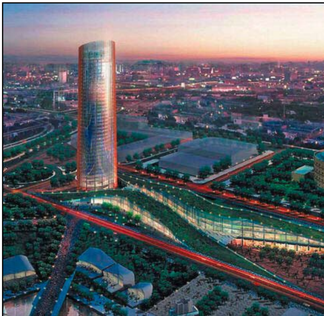
Recreación virtual del proyecto del arquitecto César Pelli para la Cartuja de Sevilla.