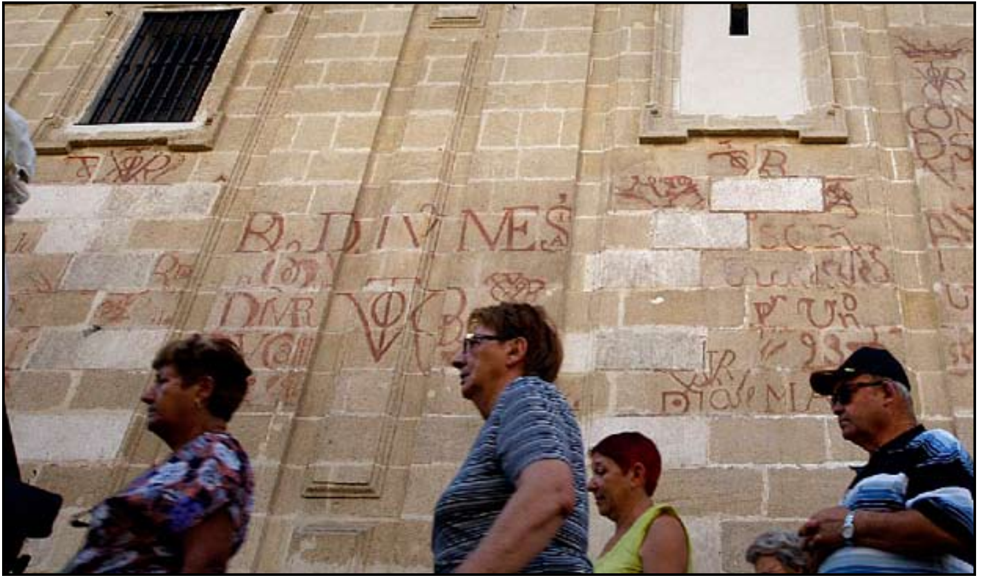
Fachada de la catedral de Sevilla, a la altura de la calle Alemanes. En la pared se pueden ver distintas inscripciones. ALEJANDRO RUESGA

9. Visita http://www.mcu.es/patrimonio/MC/PME/BienesDec/BienesDeclarados.html para conocer las ciudades españolas Patrimonio de la Humanidad y completa el cuadro.