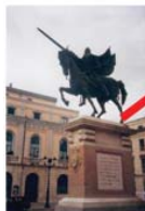
Estatua del legendario héroe castellano, en Burgos.