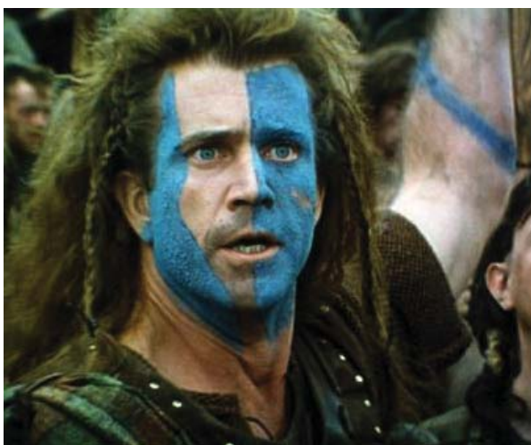
Fotograma de la película Braveheart .

AUTOR: Pelayo Molinero Gete Asesor técnico de la Consejería de Educación en Reino Unido e Irlanda.