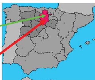
Ubicación de la provincia y la ciudad de Burgos