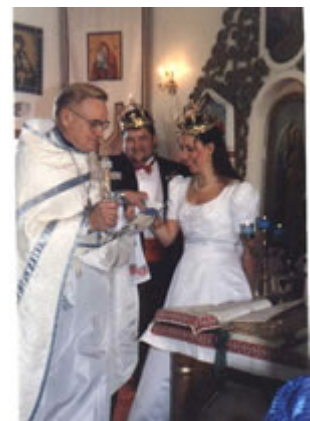
Ceremonia griega de coronación

En Hungría , el brindis más importante de la boda es cuando el novio le saca el zapato a la novia y lo usa para beber como si fuera una copa.