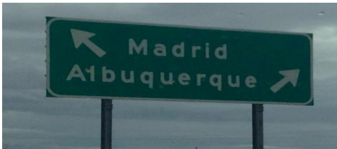
Señalización que se encuentra en las afueras de Santa Fe

Correo electrónico: losangeles.usa@educacion.gob.es