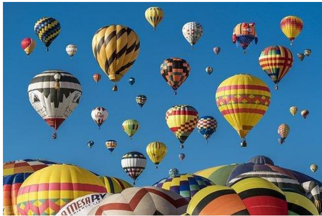
Balloon International Fiesta, Albuquerque