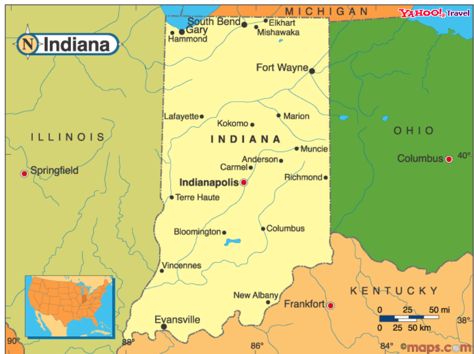
Mapa de Indiana