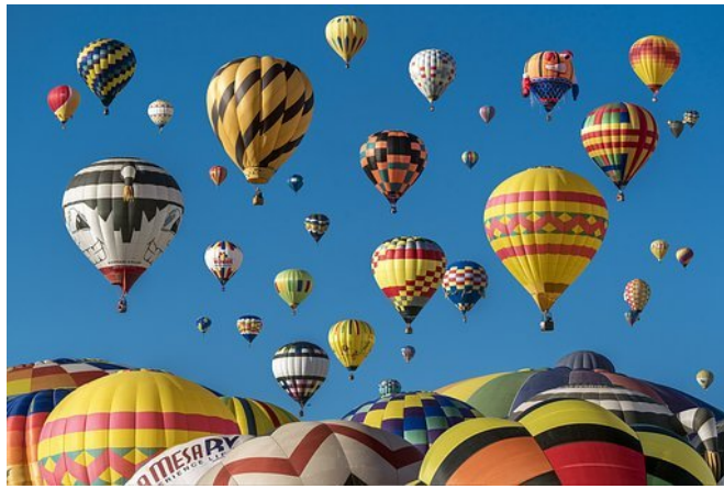
Balloon International Fiesta, Albuquerque