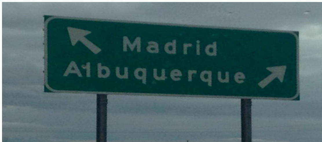
Señalización que se encuentra en las afueras de Santa Fe

Correo electrónico: losangeles.usa@educacion.gob.es