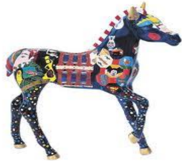
Lexington Horse Capital of the World