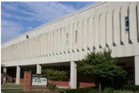
Maxwell Elementary Spanish Immersion