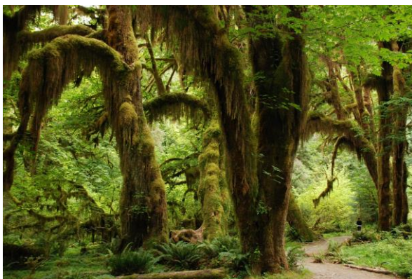
Olympic National Park

En primavera, por otro lado, podrás visitar los campos de tulipanes en La Conner. Más información en la página de turismo del estado de Washington.