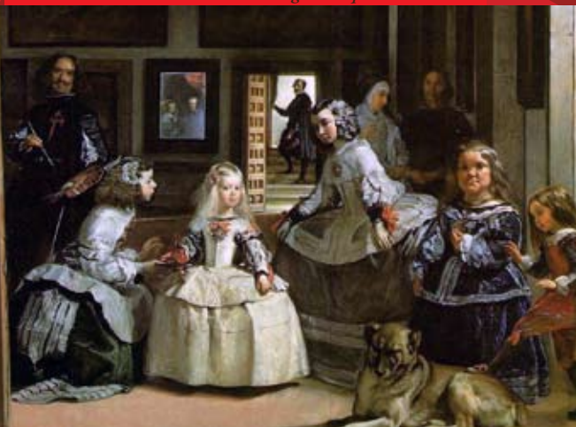
Diego Velasquez : Las Meninas