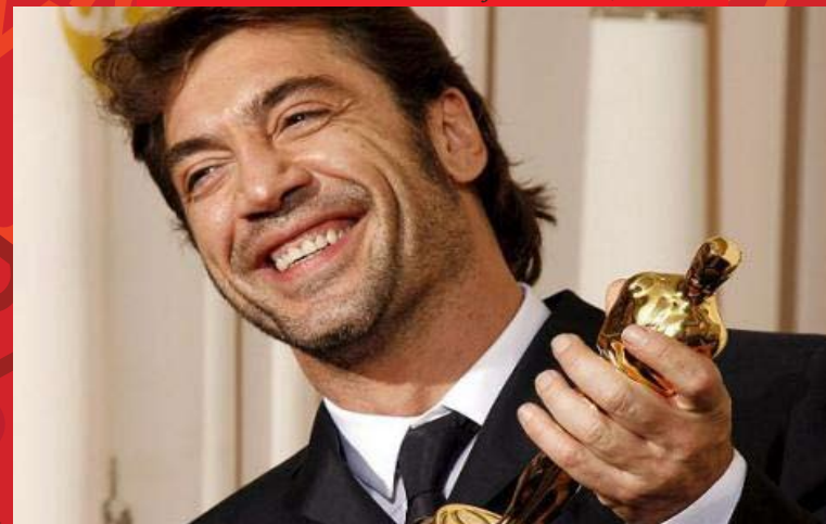
Javier Bardem, Oscar 2010

Al elegir el centro en el que cursarán sus estudios de Secundaria, los alumnos deben decidir también qué lenguas extranjeras aprenderán. En los institutos húngaros más de 10.000 estudiantes optan cada año por el español como segunda o tercera lengua, síntoma del creciente protagonismo del español en el país y en todo el mundo.