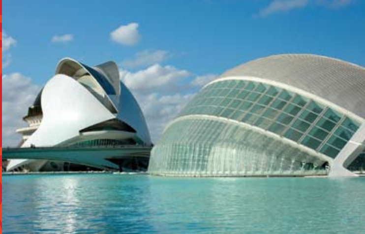
La Ciudad de las Artes y las Ciencias, Valencia