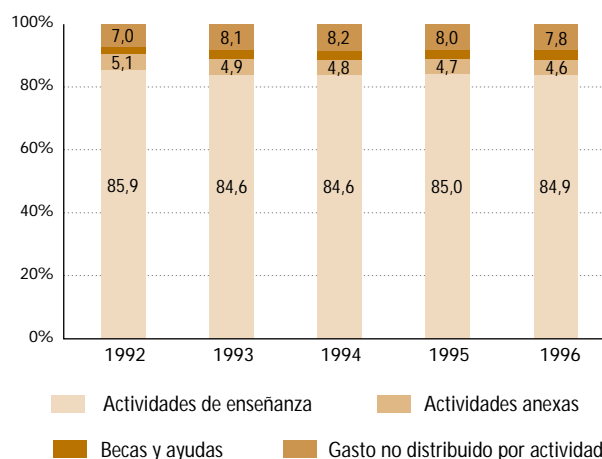
Gráfico 2.Rc2: Distribución del gasto público en educación por actividades.