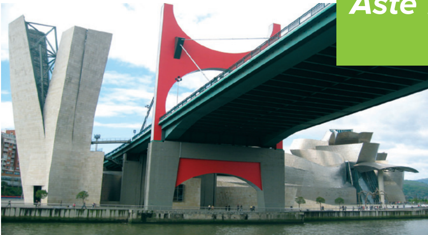
Museo Guggenheim Bilbao.

La Semana Grande de Bilbao dura nueve días.