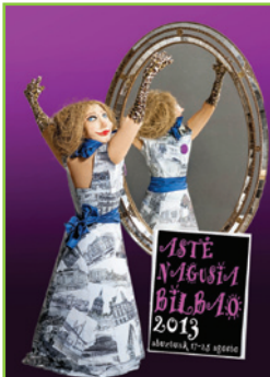
Cartel anunciador de las fiestas. Foto y cartel de Eduardo Alonso.

AUTORA: Eulalia Alonso Nieto Asesora técnica de la Consejería de Educación en el Reino Unido e Irlanda