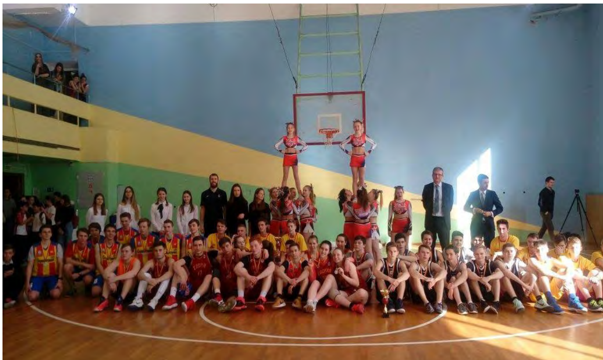
Серхио Родригес, игрок ЦСКА и испанской баскетбольной сборной, с участниками I турнира «Баскетбол по-испански», организованного Отделом образования Посольства Испании в Москве для учеников школ с Двухязычным отделением (апрель 2018 г.).