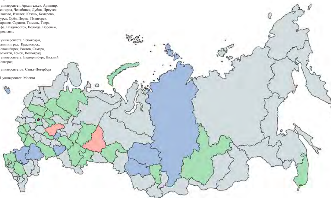
Российские университеты, предоставляющие возможность изучения испанского