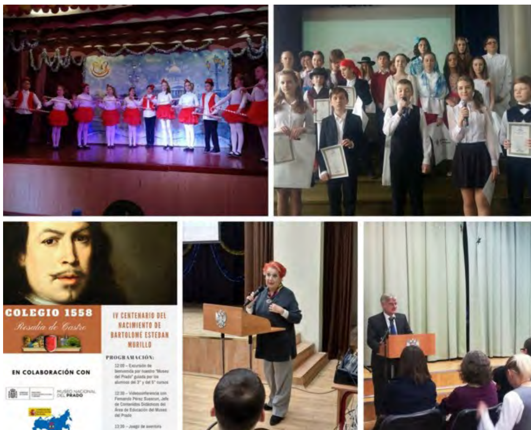
Культурные и академические мероприятия Двужычных секций в России