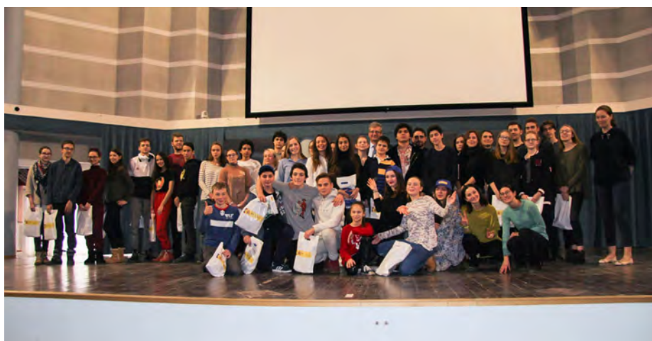
Участники Национального школьного театрального фестиваля на испанском языке для Двухязычных секций, прошедшего на площадке Казанского федерального университета в марте 2018г.

Отдел образования в России находится в Посольстве Королевства Испании в Москве, и его образовательные функции осуществляются в рамках более широкой работы по продвижению испанского языка и испанской культуры в России, а также развития международного образовательного сотрудничества. В его работе можно особо отметить расширение преподавания испанского языка в системе образования с помощью программы Двухязычных испанских отделений в средних школах, организация курсов повышения квалификации для учителей испанского языка, развитие и поддержка контактов между университетами, выпуск учебных публикаций, распространение и предоставление учебных пособий по изучению испанского языка, предоставление информации о возможности обучения в Испании и существующих стипендиях, а также оформление соответствующих заявлений и поддержка испанских учреждений, проводящих дистанционное обучение.