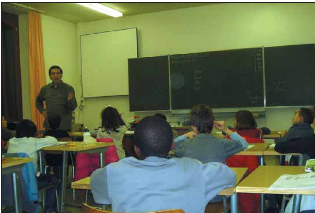
Aula de Lengua y Cultura Españolas de la Agrupación de Neuchâtel (École de Commerce).