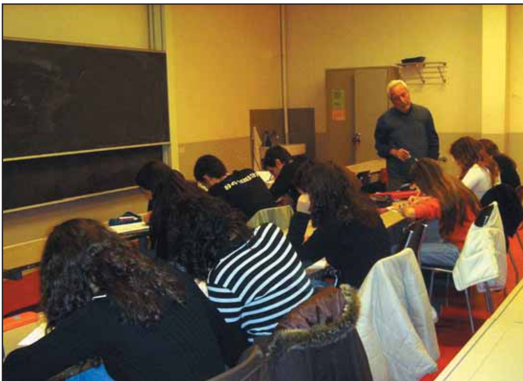
Aula de Lengua y Cultura Españolas de la Agrupación de Ginebra (Collège Calvin).